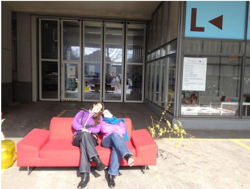
Die Ruhe vor dem Sturm